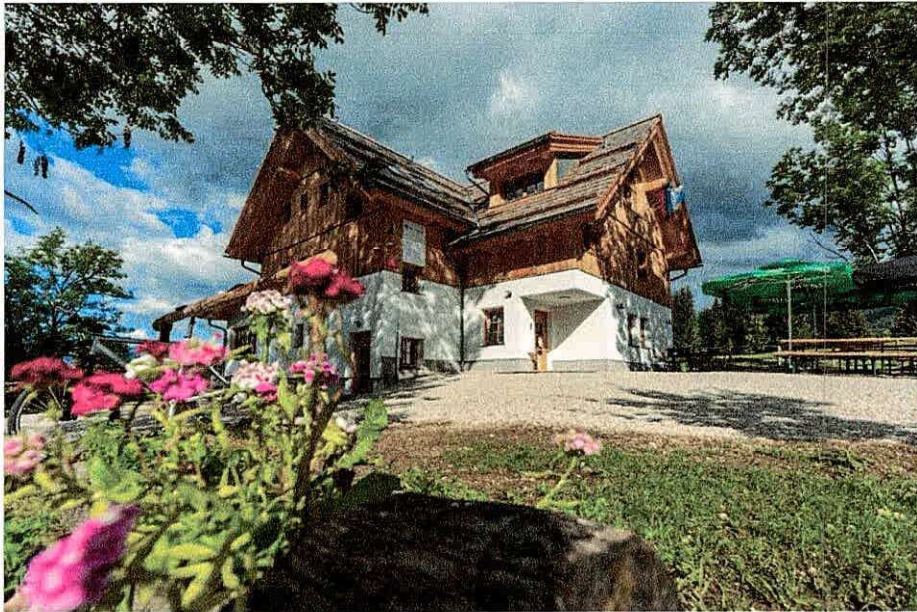
Koča na Uskovnici

Letno poročilo s pojasnili k računovodskim izkazom 2025